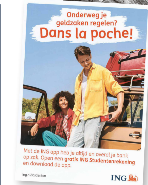
Reclame voor de ING-app uit 2018. "Altijd en overal je bank op zak".

In 1993 werd de 'Girofoon' geïntroduceerd. Girofoon begon als een saldo-informatie lijn met een voice-response programma, maar kreeg al snel meer functies. Vanaf 1995 kon men geld overschrijven en vanaf 1997 kon dat ook naar derden. Met een speciale druktoetsentelefoon met chipkaart konden klanten zelfs tot 10.000 gulden per dag overschrijven. Het lukte ook op de toen beschikbare mobieltjes.